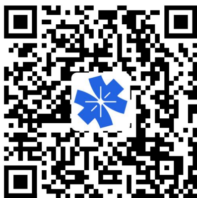
粤商通 APP 下载

如未下载粤商通手机应用，可使用微信扫描下方二维码，进入手机应用市场或 AppStore 下载。已下载粤商通应用的可以跳过此步骤。